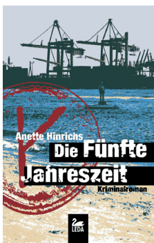
Die fünfte Jahreszeit 978-3-86412-005-3 10,90 Euro