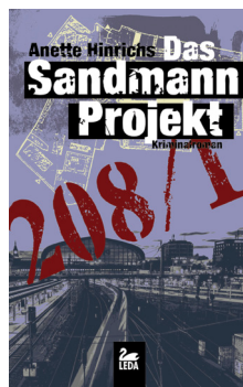
Das Sandmann-Projekt 978-3-86412-080-0 10,95 Euro