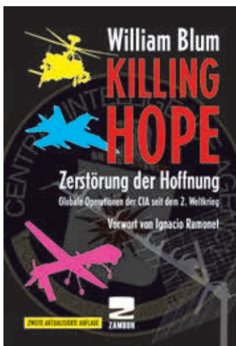
WILLIAM BLUM KILLING HOPE Zerstörung der Hoffnung Globale Operationen der CIA seit dem 2. Weltkrieg br, 14 x 20,5 cm, 792 Seiten D 25,00 € • A 25,70 € ISBN: 978 3 88975 141 6