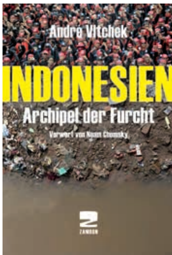
ANDRÉ VLTČEK INDONESIEN Archipel der Furcht Vorwort von Noam Chomsky br, 17 x 24 cm, 260 Seiten D 20,00 € • A 20,60 € ISBN: 978 3 88975 241 3