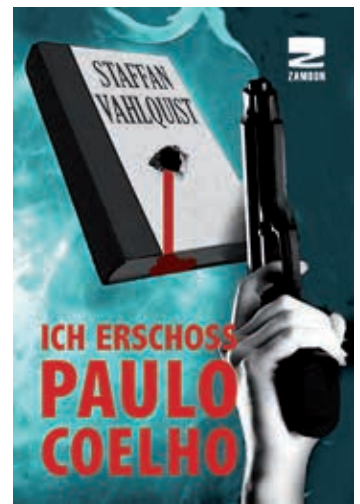
STAFFAN VAHLQUIST ICH ERSCHOSS PAULO COELHO Roman br, 14 x 20,5 cm, 128 Seiten D 10,00 € • A 10,30 € ISBN: 978 3 88975 234 5