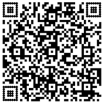
Leseprobe Bildband Pantanal