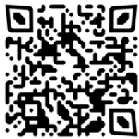
Trailer in deutscher Sprache