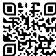
Trailer in englischer Sprache