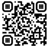
Trailer Deutsch social Media