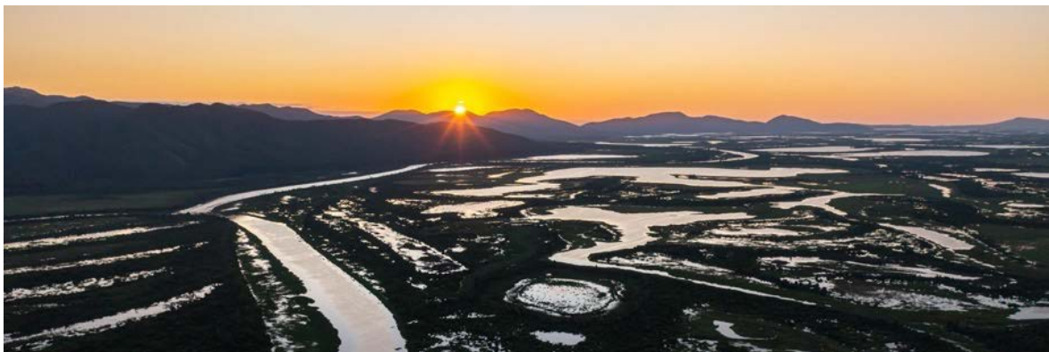
Aufregend. Einzigartig. Mitreißend.

Ein Teil des Bildbandes zeigt den Jaguar in seinen unterschiedlichen Verhalten und Beschäftigungen (Chillen, Streifzüge, Jagt, Familie, Paarung,...). Die Textabschnitte sind eine Kombination aus Erzählungen und Erklärungen, ebenso die Bildunterschriften.