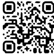
Trailer Englisch social Media