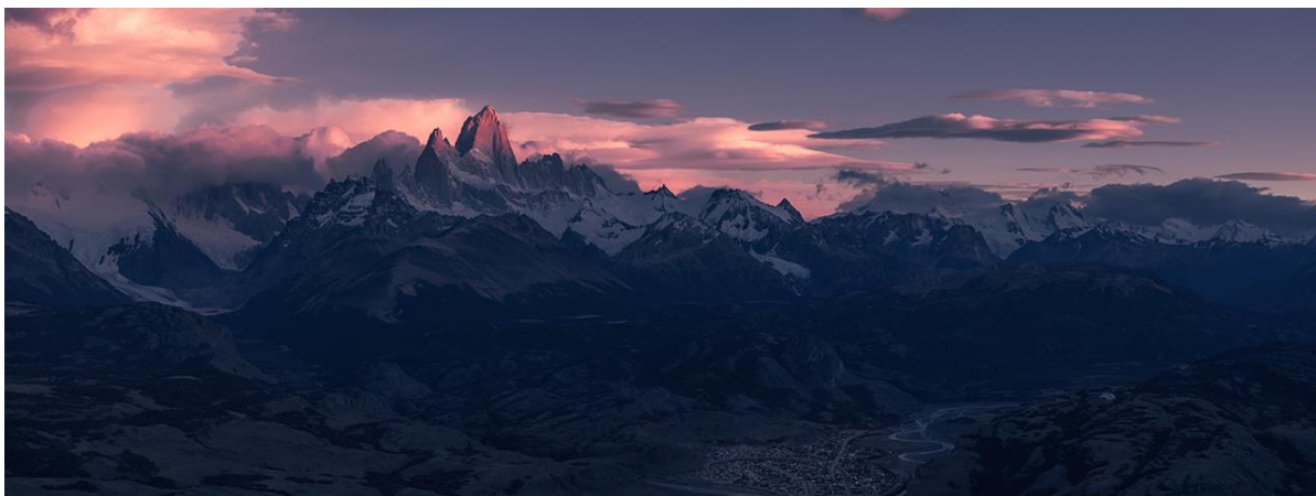
Aufregend. Einzigartig. Mitreißend.

Ein Teil des Bildbandes zeigt den Puma in seinen unterschiedlichen Verhalten und Beschäftigungen (Streifzüge, Jagt, Familie, Paarung,...). Die Textabschnitte sind eine Kombination aus Erzählungen und Erklärungen, ebenso die Bildunterschriften.